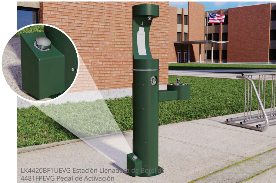
LK4420BF1UEVG Estación Llenadora de Botellas 4481FPEVG Pedal de Activación

Está disponible en 12 diferentes colores y es ideal para coordinarse con estaciones llenadora de botellas tubulares. También disponible en colores Pantone® personalizados, sólo que se requiere una cantidad mínima de compra. El pedal se vende por separado y no se instala desde fábrica.